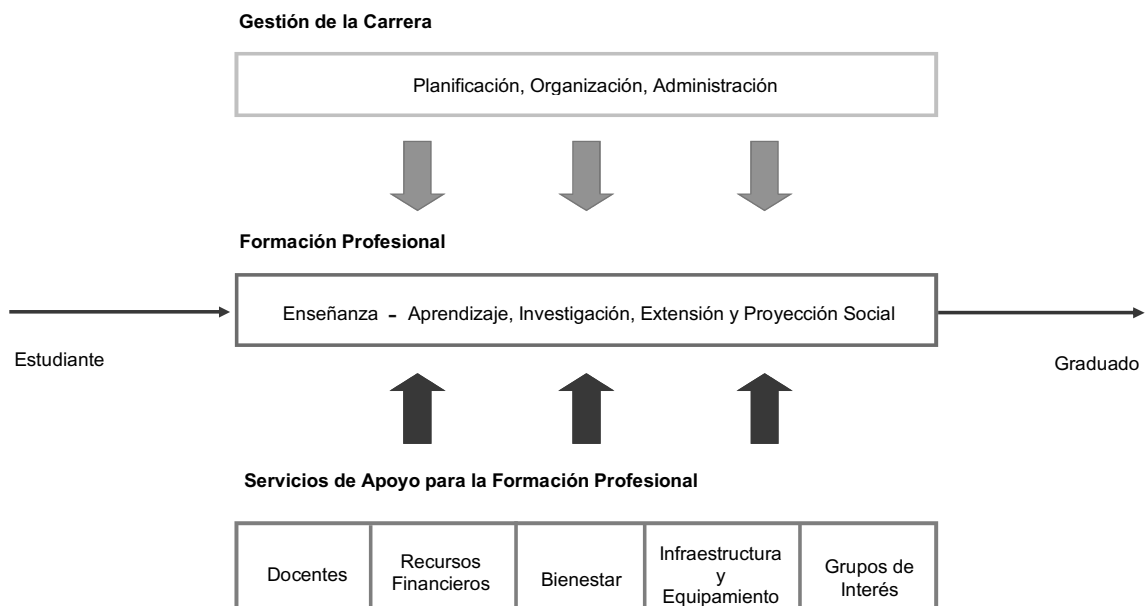
Figura 2: MODELO DE CALIDAD PARA LA ACREDITACIÓN DE CARRERAS PROFESIONALES UNIVERSITARIAS.