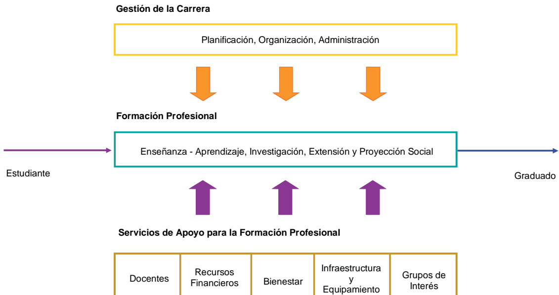
Figura 2: MODELO DE CALIDAD PARA LA ACREDITACIÓN DE CARRERAS PROFESIONALES UNIVERSITARIAS.